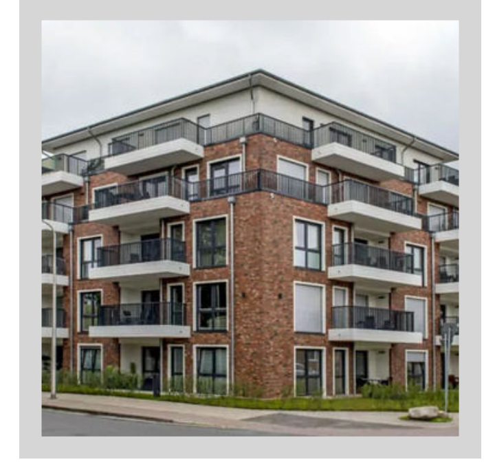
Mehrfamilienhaus im Zentrum